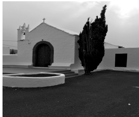
Ermita de Nazaret