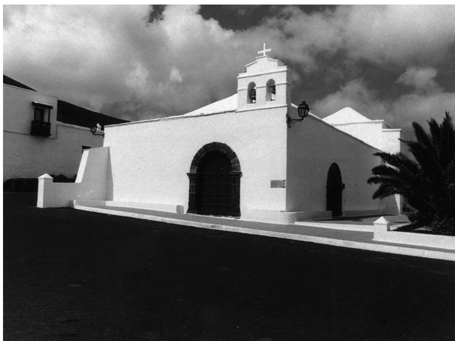
Catedral del Rubicón