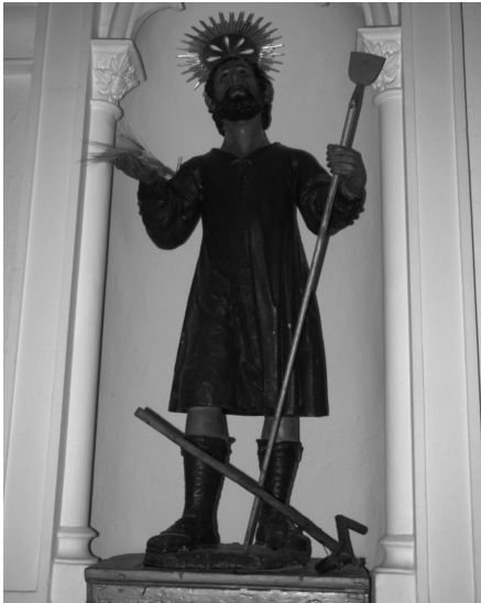
Otras imágenes en la Vega de San José