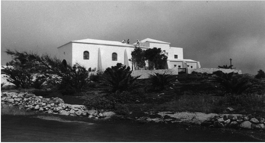
Primeras construcciones de espacios religiosos en Lanzarote