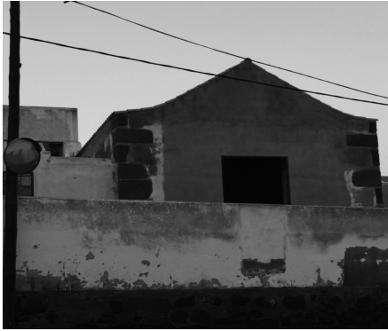
Oratorio de San Pedro en San Bartolomé