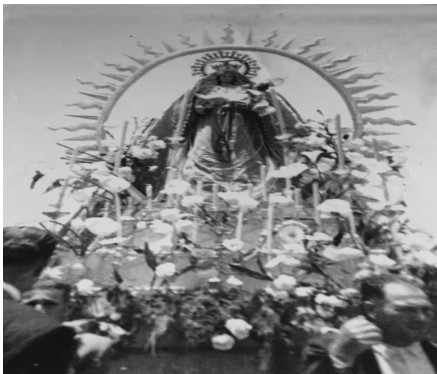
Nuestra Señora de las Nieves