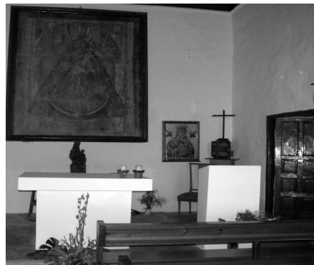
La Caridad por dentro