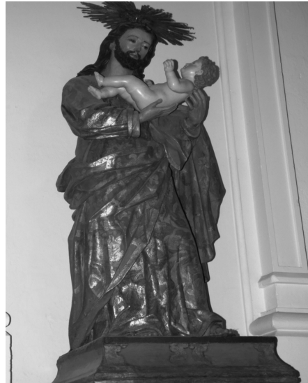
Imagen de San José