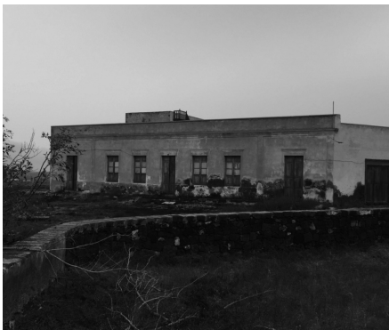
Capilla de La Florida