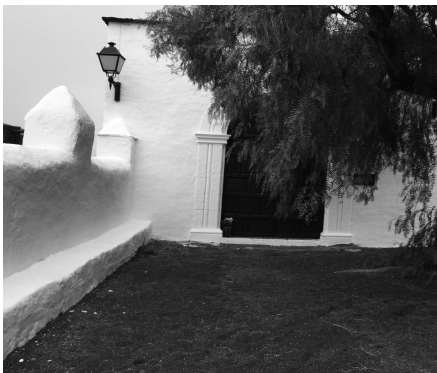
Ermita de La Caridad