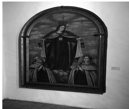
Capilla de La Florida