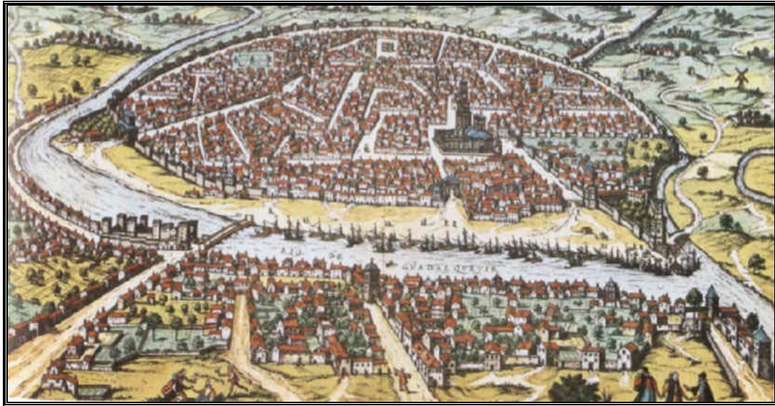
Vista de Sevilla. A la derecha del río Guadalquivir se aprecia la Torre del Oro, a sus pies Puerto de Muelas

preparar la nave que va a Canarias [Morales Padrón, Francisco. Canarias en el Archivo de Protocolos de Sevilla. Anuario de Estudios Atlánticos, número 7, 1961, página 263, nº 17].