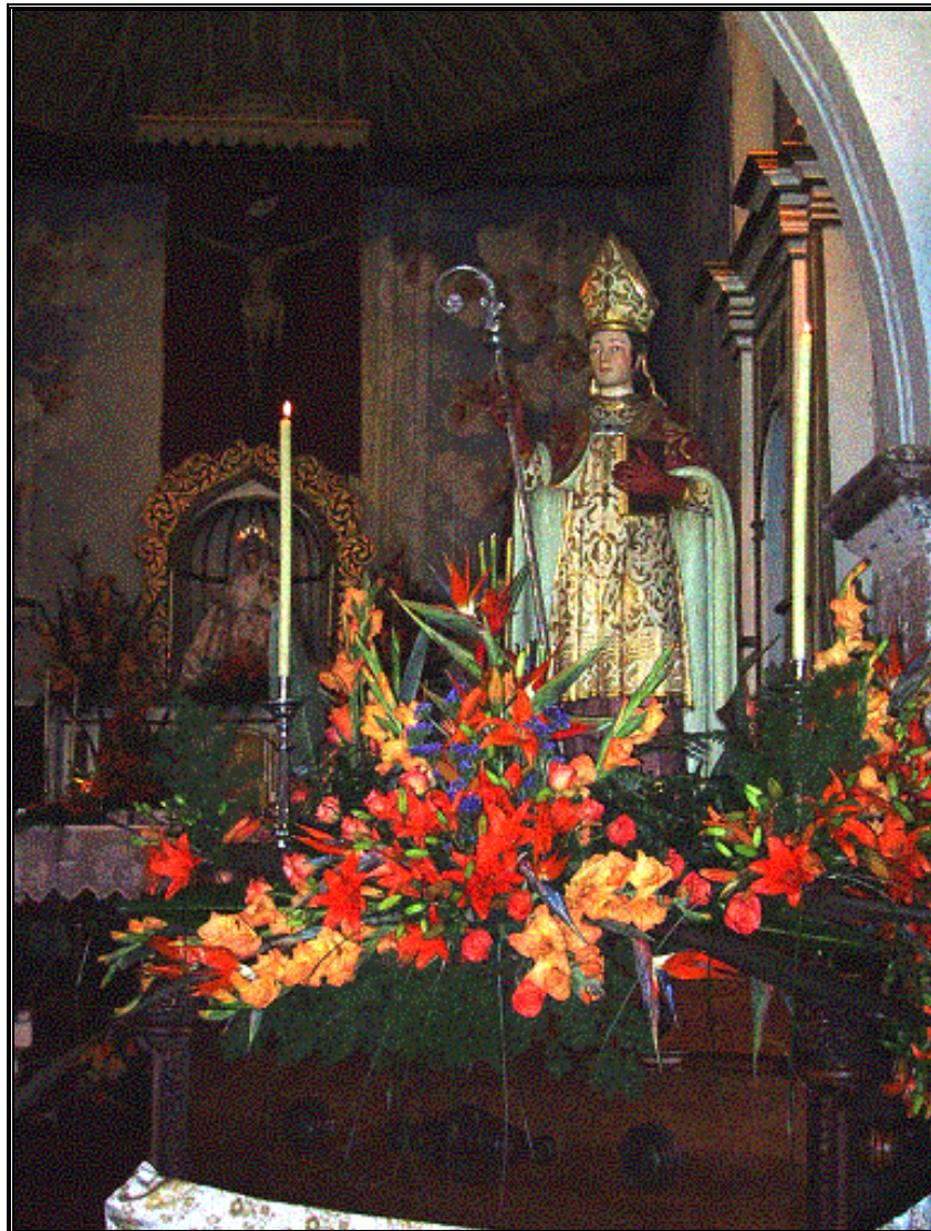
San Marcial de Rubicón (Ermita de Femés)

Hebreo de nacimiento, y, según todas las conjeturas, de Galilea. Primer Obispo de Limoges, fallece pacíficamente hacia el año 73 de nuestra Era. La celebración de su día es el 30 de junio; al no coincidir con la fiesta de San Marcial de Rubicón en Femés, que se celebra el 7 de julio, es muy probable que la concesión de la diócesis de Rubicón, por la Bula de Benedicto XIII, con fecha de 7 de julio de 1404, sea la responsable del cambio de día.