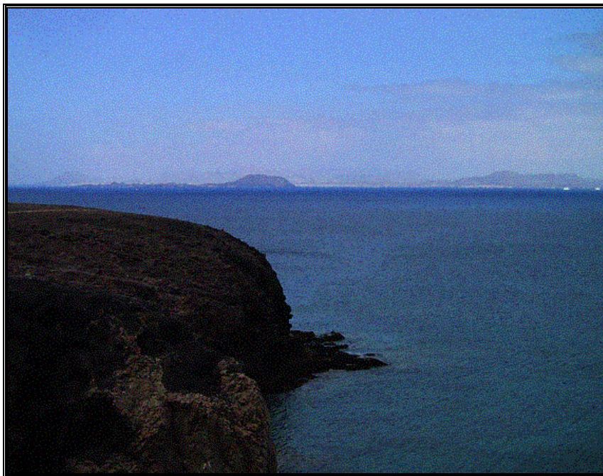
Desde la Punta de Papagayo se aprecia claramente la isla de Lobos y Fuerteventura, siguiente objetivo de los conquistadores.

Si disponían de ganado caprino en la isla de Lanzarote, ¿por qué mataron los lobos marinos?, ¿estaban enfrentados con los aborígenes?. La captura de nativos por parte de Bertín de Berneval, que traicionó a Gadifer de La Salle, supuso la ruptura del “pacto de amistad” con los aborígenes.