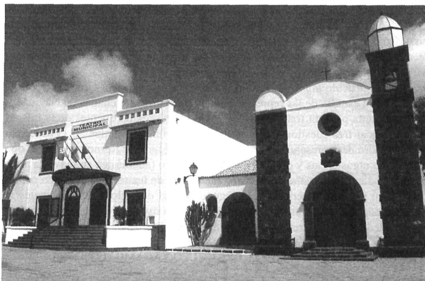
Fachada del Teatro Municipal de San Bartolomé, antiguo Teatro-Cine Parroquial. A su derecha, iglesia de San Bartolomé. (2001). Desde sus orígenes, la tradición teatral ha corrido paralela al devenir de la vida eclesiástica municipal.

tuvieron anualmente como cita obligatoria las festividades de San Bartolomé (24 de agosto) y de la Inmaculada Concepción (8 de diciembre), además del aniversario de la inauguración de los nuevos salones de la “Sociedad El Porvenir”. Asimismo, el “Grupo Yágamo” representó anualmente un auto de Navidad (diciembre-enero) y una versión propia de la Pasión de Jesucristo (Semana Santa).