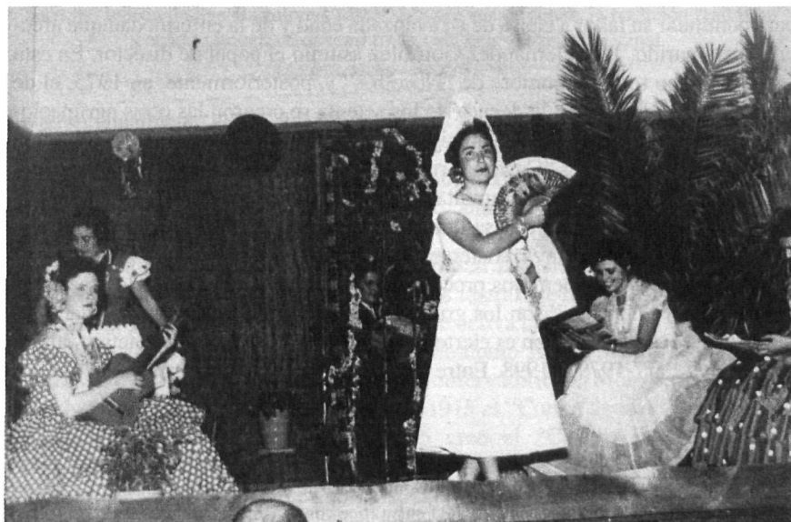
Momentos de la puesta en escena de la obra Nosotros, ellas y el duende de Carlos Llopis. Sociedad El Porvenir. 1955.