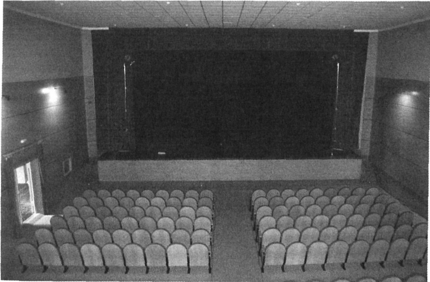
Escenario del Teatro Municipal de San Bartolomé. (2001).

ambientes andaluces, se respira también en el teatro de los hermanos Álvarez Quintero 24 ; quienes, apartados de la época convulsa en que vivieron, compusieron obras siempre huidizas de todo conflicto y tensión social (Zurro 1999: 49). Desde otra perspectiva de la creación teatral, en la producción de Alejandro Casona tampoco cobra particular relieve el contenido ideológico. Precisamente, La dama del alba , una de las obras puestas en escena por el grupo, “es la más profundamente poética de cuantas escribió el dramaturgo asturiano”, de modo