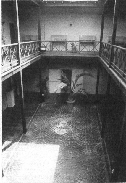
Vista parcial del Salón de Recreo del Teatro Municipal de San Bartolomé. (2001).

de la dedicación al sector primario, ha hecho de San Bartolomé un enclave dormitorio (Bencomo 1997: 14, Llés y otros 1998, Perdomo Aparicio 1996: 32). A este respecto, debe señalarse que no sólo la población natural ha buscado trabajo fuera de su pueblo, sino que además éste se ha convertido en un polo de atracción de personas en busca de residencia ante su estratégica posición geográfica entre Arrecife y Tías. En función de lo expuesto, y teniendo en cuenta la espectacular evolución de la estructura poblacional de San Bartolomé (v. Cuadro 3), se entiende que la situación posterior al boom sea justamente la contraria a la descrita para la etapa anterior: mayor movilidad externa, amplio crecimiento de los contactos extralocales y descenso en la complejidad y densidad de relaciones dentro de la red social. Por otra parte, el núcleo de difusión cultural ha dejado de ser la iglesia pasando a ser la institución pública 18 (Ayuntamiento y Cabildo), lo