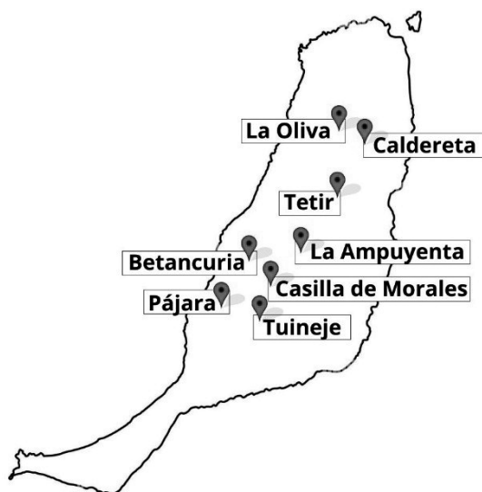
Imagen 2. Compañías de milicias de Fuerteventura, 1771-1802