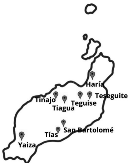
Imagen 1. Compañías de milicias de Lanzarote, 1771-1802

Los lugares más importantes eran los de las primeras compañías, mientras que los más alejados y privilegiados eran los últimos. En cuanto al armamento, todos los milicianos estaban armados y municionados, con hasta 8000 cartuchos, repartiendo mil para cada compañía. Sin embargo, estas cifras no nos deben llevar a engaño pues la mayor parte se hallaba en mal estado. Solo 527 fusiles y bayonetas tenían una calidad buena, mientras que los cartuchos se hallaban inútiles, almacenados en el fuerte de Santa Bárbara, con un total de 28 580, más 900 piedras de chispa para causar la ignición del fusil. En cuanto a las banderas del regimiento estaban inútiles e indecentes [...] por la poca custodia que desde su principio tuvieron . Por último, el Reglamento de Milicias Canarias de 1771 menciona en su artículo n.º 70 la existencia de tres medias compañías de artilleros milicianos formados en Teguiise, Puerto de Arrecife y lugar de Femés, y que fueron agregadas al regimiento de milicias de la isla 22 .