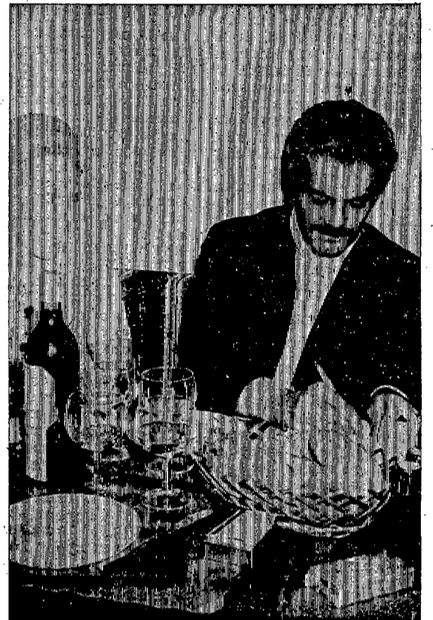
Omar Sharif, firmando un autógrafo en el "Arrecife Gran Hotel" durante el rodaje en Lanzarote de "La Isla misteriosa".

Por cierto, que una versión del referido filme "La isla misteriosa", rodada íntegramente en sus exteriores en Lanzarote y protagonizada por Omar Sharif, se está pasando desde hace varios miércoles por T.V.E., habiendo tenido con tal ocasión motivo los telespectadores de contemplar numerosos paisajes lanzaroteños, sobre todo volcánicos, aunque no en color, pues la película fue obtenida en blanco y negro. Y volviendo a "Viaje al centro de la Tierra" diremos que en breve conversación que hemos mantenido en el hotel "Lancelot Playa" con el director de efectos especiales,