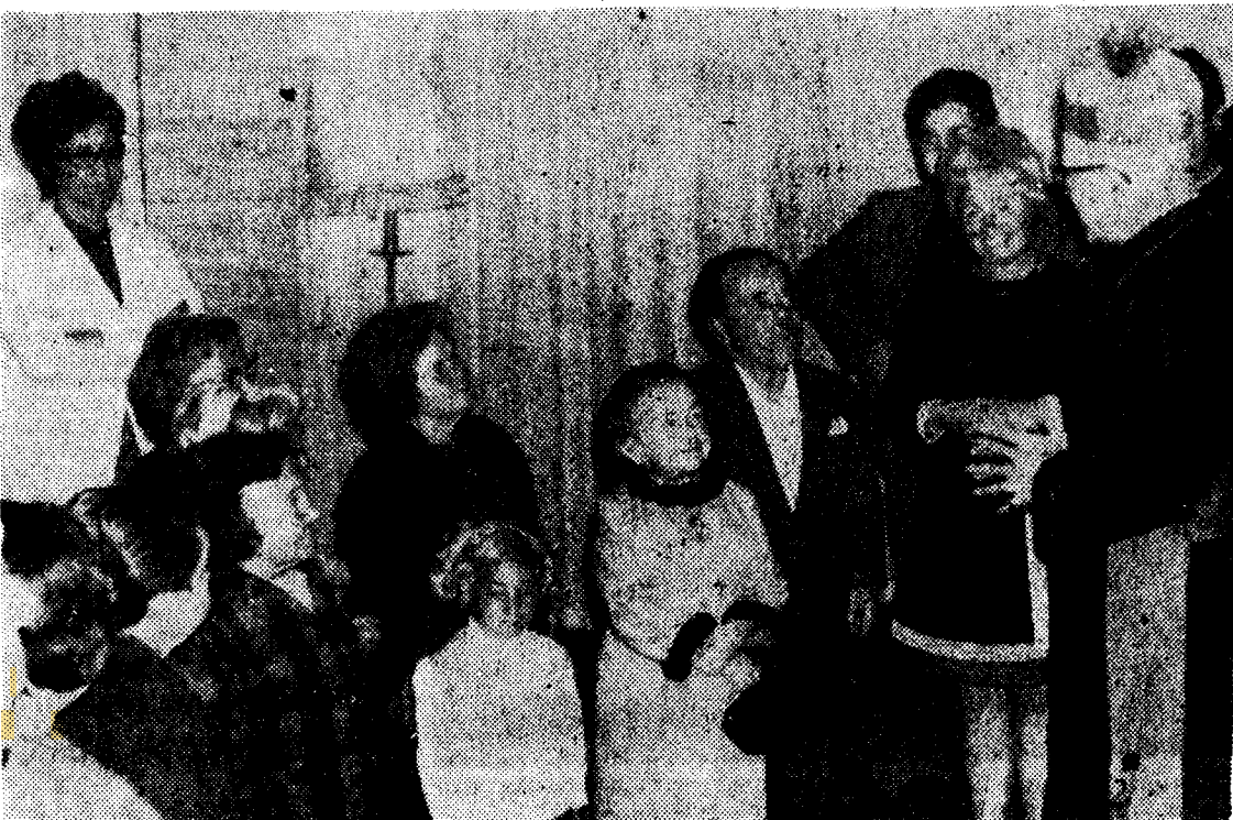
Los liliputienses alemanes, con el Obispo de la Diócesis. Una simpática y bella entrevista.

En la jornada del sábado el Prelado efectuó su anunciada visita a Tías, Tiqua y Tegüise. En estas distintas parroquias va recorriendo uno a uno todos los barrios y en cada uno de ellos habla con los fieles, recordándoles su misión como Obispo, que les trae la Palabra de Dios y su Espíritu Santo. Se detiene en Moraga, Taz, Tiqua, Mufique, Soo, Caleta de Famara, Tablache, Nazareth, Teseguite, El Mojón y Los Vaillos. Confirma a unos niños en Taz y Tiqua visitando también ancianos y enfermos. Ya a las 7.30 de la tarde y siguiendo su agotadora jornada se reunió con la Comunidad de Tegüise en su Templo Parroquial. Durante esta reunión Eucarística confirma a 141 fieles. A continuación en el Salón Parroquial mantiene una reunión con los jóvenes para