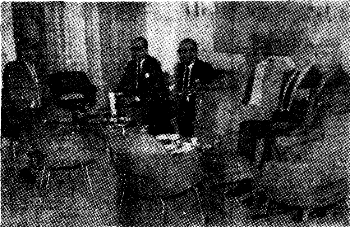
He aquí un grupo de señores de los considerados como amigos de siempre por la Dirección del Hotel Reina Isabel de nuestra capital, en razón a que hacen su tertulia a diario en aquel lujoso establecimiento hotelero de la playa de Las Canteras.

contentos y satisfechos quedaron de pasar velada tan feliz al