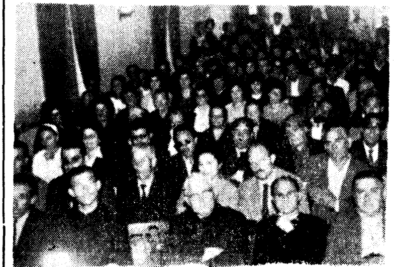
Salón de actos del "Liceo de Firgas" con un lleno completo en las Semanas Culturales celebradas anteriormente.