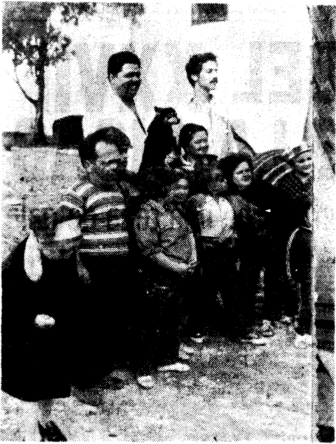
El productor alemán Werner Herzog con un grupo de liliputienses posa en un descanso del rodaje de "También los enanos empiezan pequeños". Premio Internacional de Berlín.

La prestigiosa revista "Cine en siete días" en su último número llegado hoy destaca en primera página el siguiente titular con grandes caracteres "Premio internacional no valorado en España".