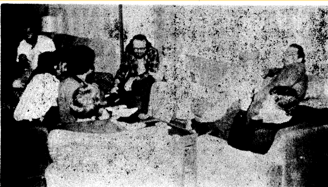
Momento de la rueda de Prensa.

Y fue imposible sacarle título alguno. Un compañero pregunta entonces si el nuevo cine de sello oriental («Kung-Fu») y demás artes orientales puede desbarcar a los «westerns». Y dicen que no, que las películas del oeste han comenzado una nueva etapa, que van a mejorar y perfeccionarse; que se harán films del tipo de los Ford o De Mille, pero con todas las nuevas técnicas del cine; que será un nuevo volver a empezar pero con nuevos conceptos. En resumen, que no perjudicará a los «westerns», y si por el contrario, se ayudarán y serán compatibles. Le pregunto a Lee Van Cleef