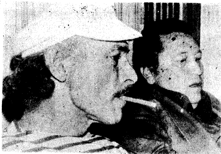
El protagonista y el director de la película.

El cine es así. Nos hace crear una imagen completamente distinta de un actor, de una actriz, que muchas de las veces ni siquiera tiene el más mínimo parecido con la realidad. Y eso nos pasó ayer tarde. El personaje: Lee Van Cleef; así, a secas, porque con este hombre y este nombre uno puede libremente ahorrarse las presentaciones. Pero hay que añadir, por si acaso, que es el popular actor de los «westerns», vamos, de las películas del oeste, sobre todo. Por ejemplo: «Por un puñado de dólares», «El bueno, el feo y el malo», etcétera.