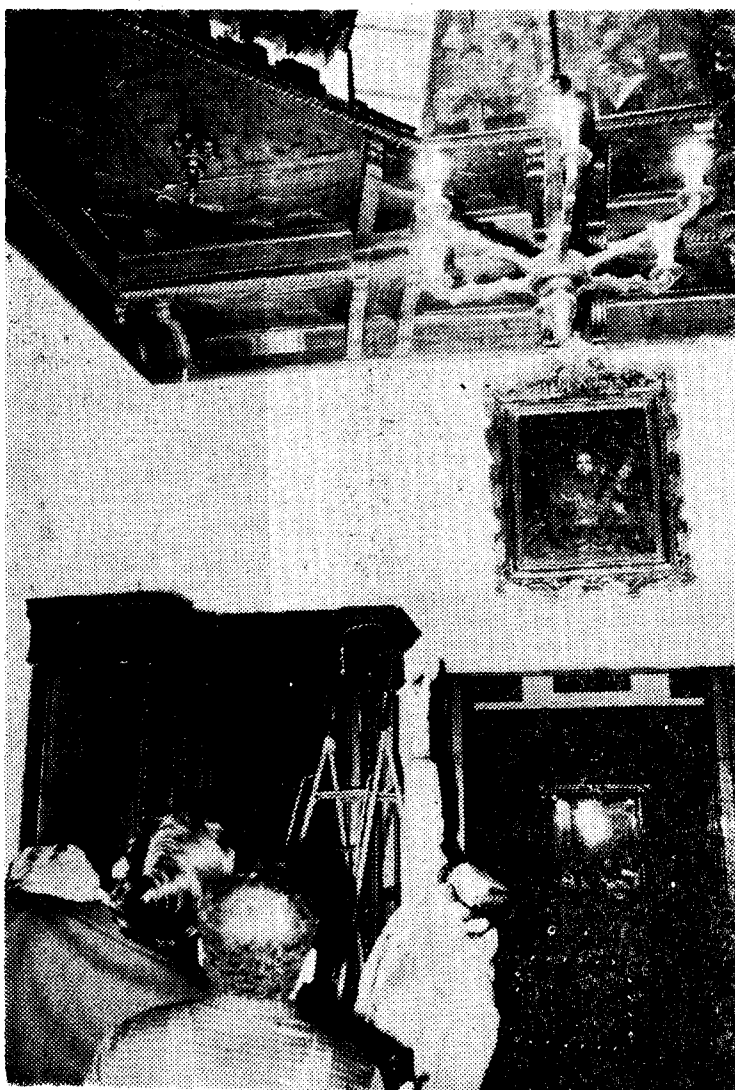
La noticia del mes —y del año— en enero es el robo de las joyas de la Virgen del Pino.

9.—Sube el precio del pan en Las Palmas. En nuestra capital se consumen 57.000 kilos de harina diarios, por 58 panaderías, 17 de las cuales se reúnen en una Cooperativa. En general el pan de Las Palmas es de mala calidad por la harina, el agua y el clima.