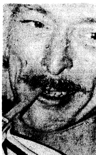
Gesto característico de Lee Van Cleef.

A cuál es la película de cuantas ha protagonizado que más le agrada y recuerda, responde