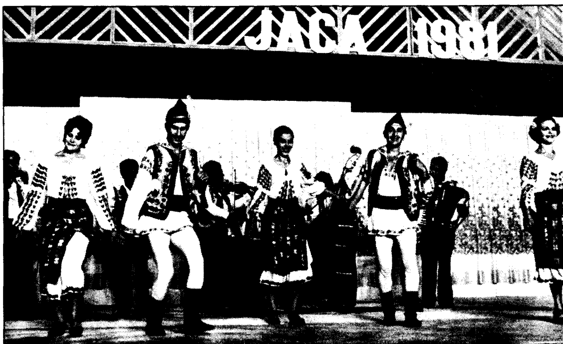
JACA (Huesca). —La totalidad de los componentes del grupo folklórico de Rumanía, que actuó en el reciente Festival de Jaca, han solicitado asilo político en una localidad francesa. En la fotografía, el grupo disidente durante su actuación en el referido Festival.