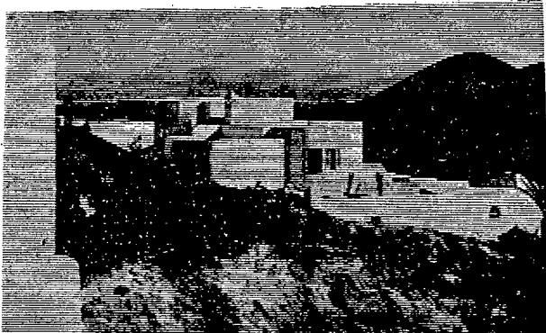
La urbanización "Oasis de Nazaret", primer lugar de trabajo de Ustinov en Lanzarote.

* El pasado año obtuvo el premio "Cámara de Oro" como el mejor intérprete de la televisión alemana.