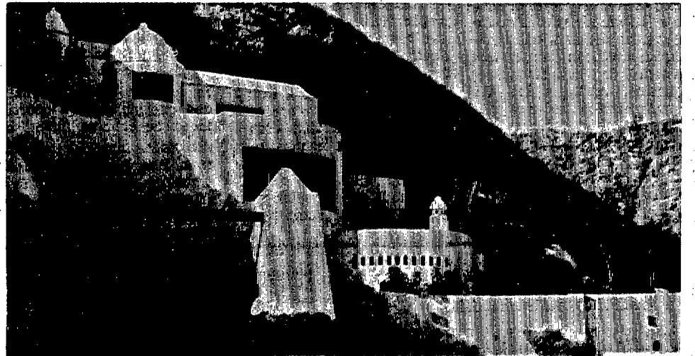
El chalet que el famoso actor cinematográfico egipcio posee en el Oasis Nazaret, en la villa lanzaroteña de Tegüise.