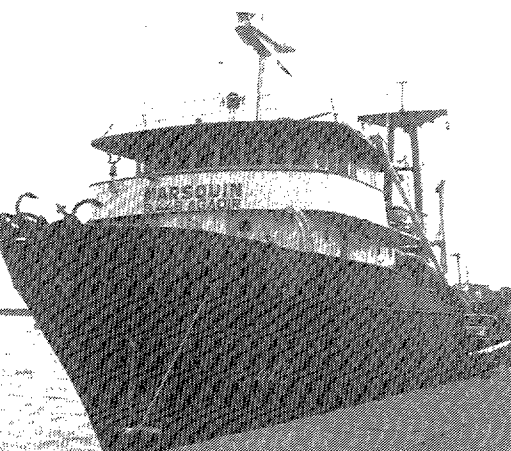
Este barco pesquero de Lanzarote fue utilizado como decorado.