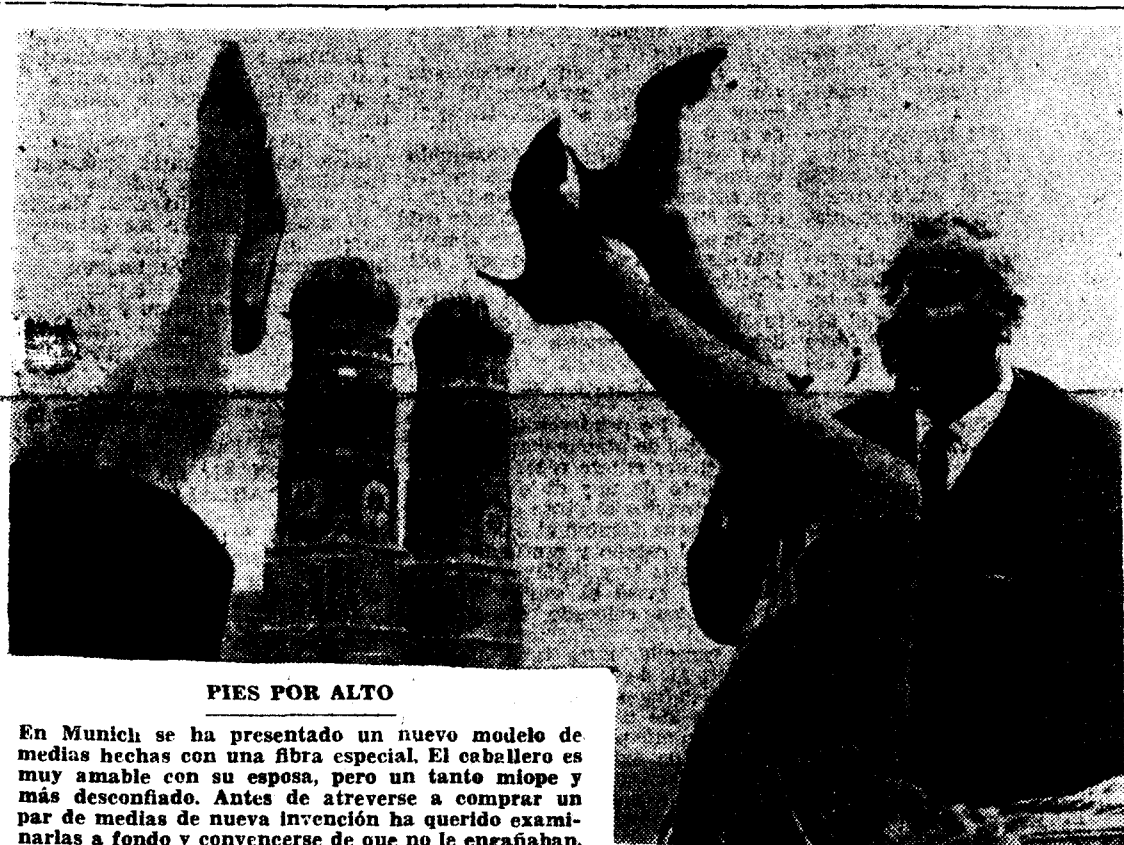
PIES POR ALTO

En Munich se ha presentado un nuevo modelo de medias hechas con una fibra especial. El caballero es muy amable con su esposa, pero un tanto miope y más desconfiado. Antes de atreverse a comprar un par de medias de nueva invención ha querido examinarlas a fondo y convencerse de que no le engañaban.