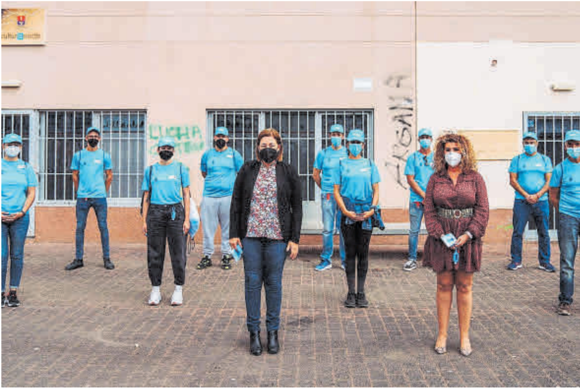
En primer término, la alcaldesa, la concejala de Juventud y los 10 informadores contratados en Arrecife.

De manera complementaria durante, durante este mes- según se destacó en esta presentación, la actuación de los equipos promo-