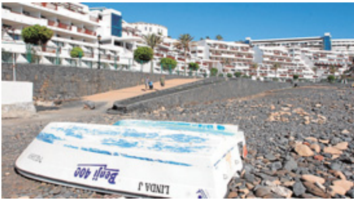
Hotel objeto de polémica en la costa de Yaiza.