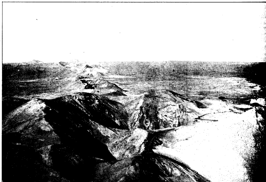
El exorcismo de Lanzarote vuelve a servir de escenario para una película

«La Iguana» fue una de las primeras novelas que escribió Alberto Vázquez Figueroa,