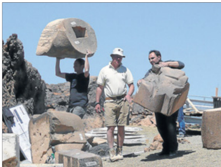
Trabajo. Desde hace una semana se trabaja a marchas forzadas en los decorados que se han levantado en distintos lugares del Parque Nacional del Teide. Abajo, imagen de la gran caldera de Las Cañadas.

Dentro de ese secretismo, hasta que hace unos días no se comenzara a levantar los decorados en Las Cañadas, nadie sabía con certeza dónde se iba a grabar exactamente. Es más, la productora tinerfeña Sur Film Production & Services tenía firmado por Warner Bros. un contrato de confidencialidad que le ha impedido desvelar cualquier detalle de los previos al desembarco de del equipo al completo. Si ha trascendido que esta empresa, entre otras cosas, está encargándose de los casting para contratar a un centenar de extras locales.