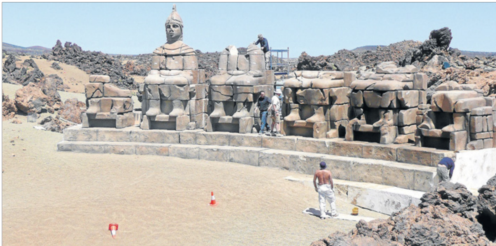
Decorados. Los decorados del Teide están prácticamente montados y a la espera de que aterrice en Tenerife el equipo que se encargará del rodaje de Furia de Titanes .

Hollywood vuelve a Las Cañadas. 42 años después de que se grabara en Tenerife 'Hace un millón de años' la isla acoge otra superproducción 'hollywoodiense' ➤ Del 15 de mayo al 3 de junio se rodará 'Furia de Titanes'