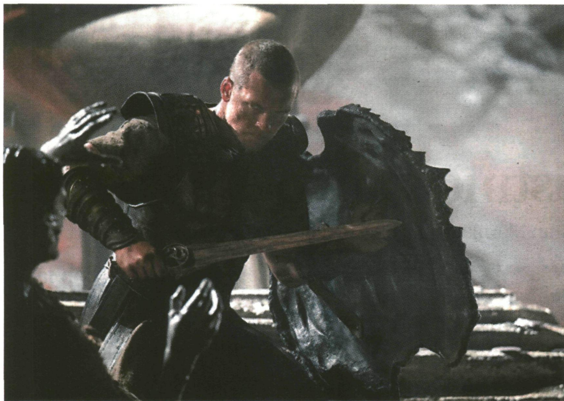
El actor Sam Worthington en el papel de Perseo en un fotograma de Furia de titanes .