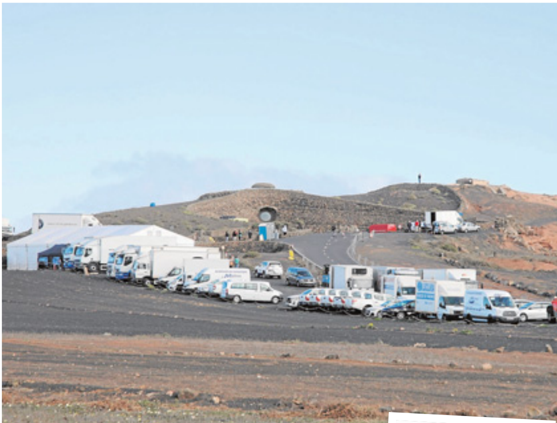
Mirador del Río y volcán de La Corona, con vehículos y material de Surf Film. CARRASCO

El FC Cartagena, Efesé para los no iniciados, juega contra el Valladolid el próximo viernes. Para promocionar el encuentro, el club ha ideado un cartel con la leyenda 'Encuesta del P-CIS' y la pregunta '¿Ganará el Valladolid?'. Aparecen cuatro posibilidades de respuesta: 'Obvio que sí', 'Claro que sí', 'Sí' y 'Efesé'. Para rematar a puerta, le han puesto el 'hashtag' #TezanosNoMeFalles. Unos cachondos, los tíos. Tras las risas, en Twitter algunos han empezado con lo de Real Valladolid. Que si al Madrid siempre le ponen el Real delante y a ellos no. A mí lo mismo me llaman Rosa que Lollita que Pilar, y con lo que quieran llamarme me tengo que conformar, pero los pucelanos no se conforman, y que si son Real, y de cuna, pues lo son. Eso sí: cuando vengáis a Cartagena a ver el partido, pedid un asiático. Ya me lo agradeceréis.