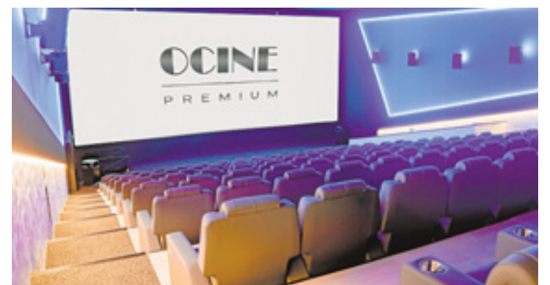
Las salas abrirán en el segundo semestre de este año. c7

Su propuesta se trata de 'cine premium' en Gran Canaria, previsto para abrir en el segundo trimestre de este año, y que incorporará ideas innovadoras en cuanto a imagen, sonido, confort y decoración que serán novedad en las islas y que se suman a la nueva imagen del centro comercial.