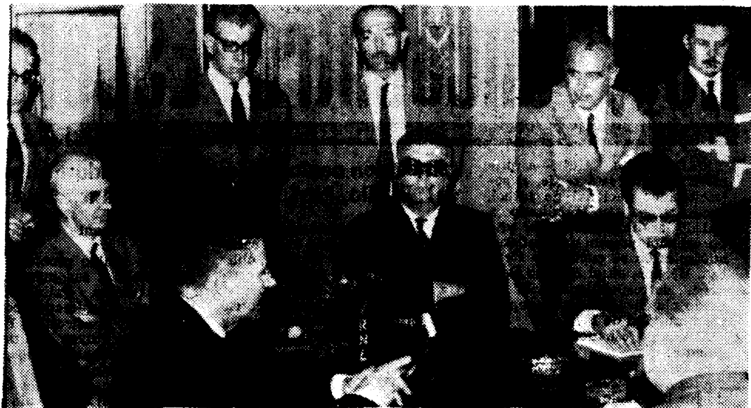
Palabras del ministro de Agricultura en la rueda de prensa celebrada anoche en el Gobierno Civil.