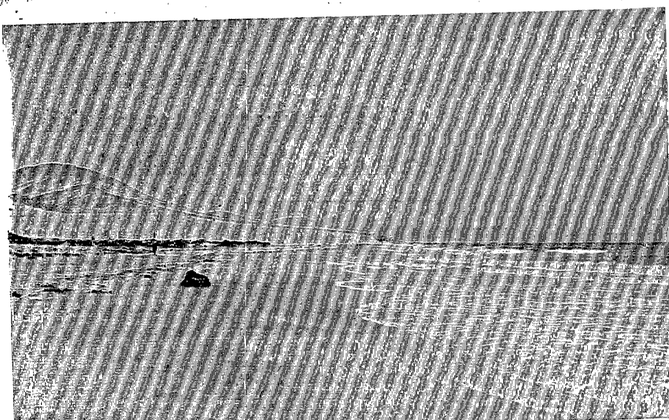
Las playas de Jandia de las que se recoge en la fotografía una vista parcial, han sido descubiertas para el cine.

—Unas setenta entre artistas técnicos y personal de oficinas, todos los cuales vendrán directamente desde Inglaterra, más un equipo de personal del sindicato español. También serán contratados extras de la isla, chicas y chicos principalmente.