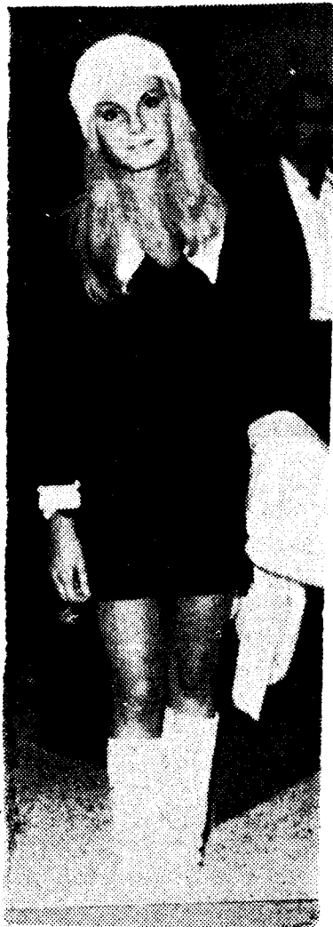
VICTORIA VETRI

En el vuelo de Madrid, a las nueve y media de la noche, llegó a Las Palmas, procedente de Londres, la actriz Victoria Vetri, protagonista de la película inglesa "Cuando los dinosaurios reglan el mundo", que mañana comenzará a rodarse en Fuerteventura, isla que será escenario íntegro de los exteriores de este film.