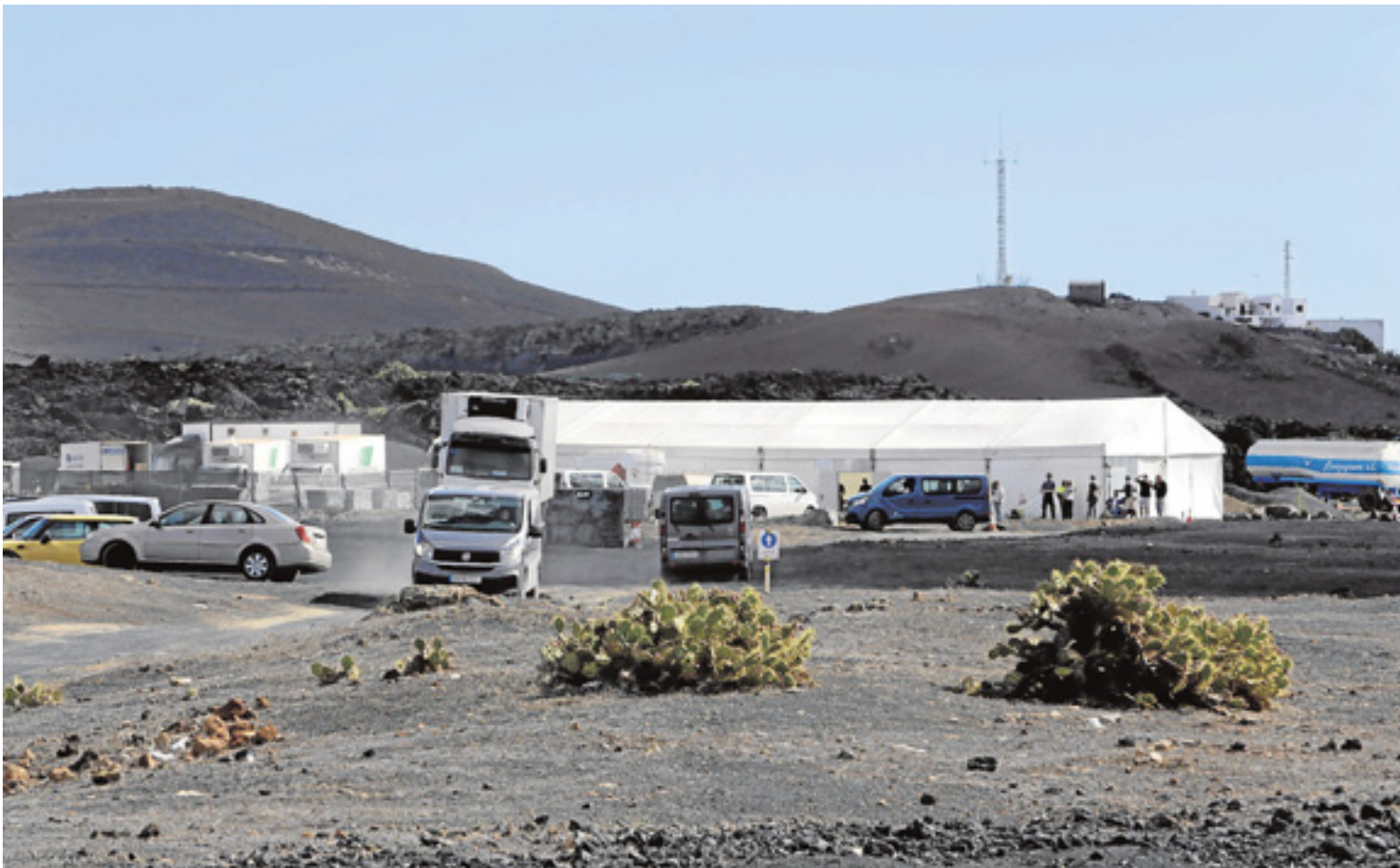
Rodaje en noviembre del pasado año de la superproducción de Marvel y Disney 'Los Eternos', en una zona volcánica de Tías.