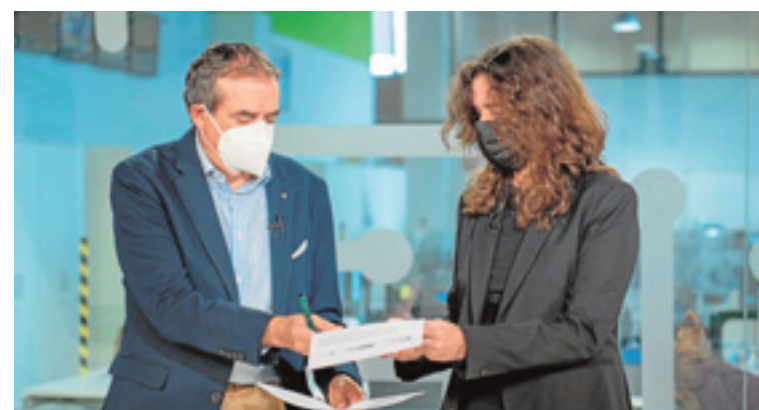
Imagen de la firma ayer del acuerdo. RTVC

los recursos de RTVC para lanzar mensajes que contribuyan a la igualdad y también impulsar la conciencia que ya existe en la empresa al respecto. «La igualdad está muy interiorizada en la filosofía de la empresa, ya existe conciencia no solo de las mujeres que representan el 44% de nuestra plantilla, sino también por los hombres», dijo.