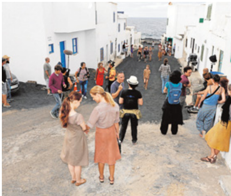
Rodaje en la costa de Tinajo en 2014. CARRASCO

En relación con este último trabajo, cabe indicar que el estreno estaba programado para este mes. Sin embargo, por la situación sanitaria a nivel mundial se ha optado por esperar a 2021. Algunas fuentes hablan de febrero, pero parece que la opción más factible es el 5 de noviembre.