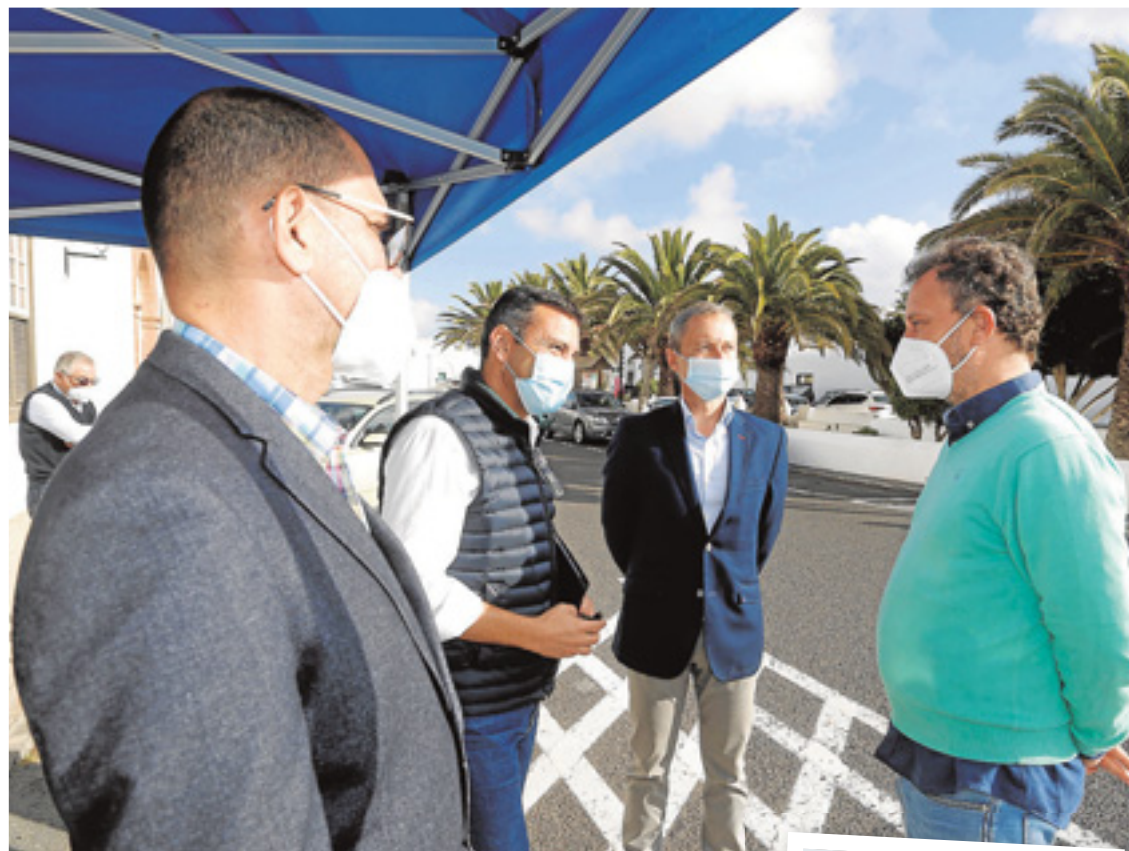
Autoridades de Tegui con responsables de 'Bienvenidos a Edén'. Claqueta inicial. c7

Me imagino a doña Letizia aleccionando a la princesa de Asturias sobre su comportamiento en el colegio, sobre ser ejemplar. Cualquier cosa que hagas tendrá importancia. La imagen y la dignidad de la institución está también en sus manos. Mira cómo estamos con el abuelo. Y ahora con las tías. No fumes (como Alexia de Holanda). Prefiero ser Dolly Parton que princesa.