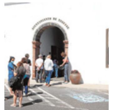
Instalaciones de Tegui se. J.L.C.

JOSÉ R. SÁNCHEZ. El Consistorio de Tegui se ha cerrado con Ifuert la adquisición de cuatro vehículos eléctricos de diverso rango, por casi 150.000 euros, fruto de un concurso público, para su incorporación al parque móvil local. Además, se invertirán 17.500 euros, para tres puntos de recarga, que serán instalados por Imesapi.